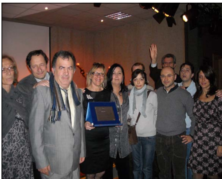
Foto-ricordo della redazione per il premio ANMIL