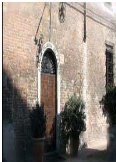
ANTICA OSTERIA DEL TEATRO

Le botteghe storiche conservano arredi e decori artistici di grande pregio, profumi e colori che rendono il territorio interessante anche per lo shopping, attraverso la ricerca di testimonianze del passato in cui si possono ammirare gli stili degli arredi originali, le vetrine ornamentali e seguire profumi, odori e sapori di una volta di prodotti artigianali che vengono eseguiti ancora oggi come secoli fa.