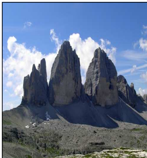
LE TRE CIME DI LAVAREDO

La particolare struttura geologica fa sì che i due terzi del parco sia costituito da rocce e detriti, tra cui riescono a crescere alcuni fiori come la potentilla persicina, il rododendro nano, la profumata orecchia d'orso delle rocce. Nelle parti meno franose del parco riescono tuttavia a crescere alberi come i larici e i pini cembri.