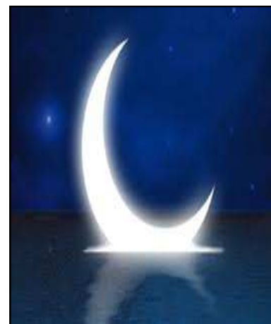
LUNA E MEZZALUNA