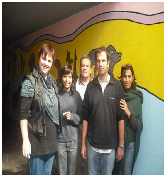
ALCUNI PARTECIPANTI AL GRUPPO