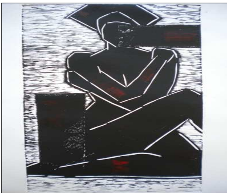
Nudo di donna