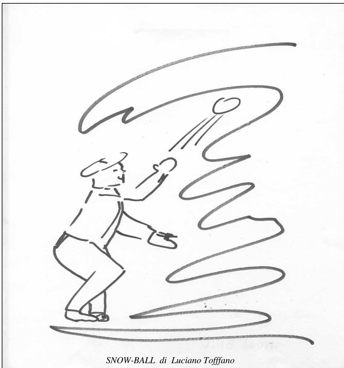
SNOW-BALL di Luciano Toffano

Periodico lunatico a cura della redazione del Centro Diurno dell'ASL di Piacenza