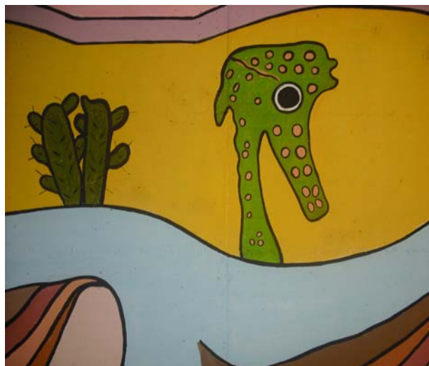
UN PARTICOLARE DEL MURALES