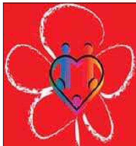
Il Logo delle “Parole Ritrovate”

Decidiamo di non commentare questa breve intervista lasciamo i riflettere i nostri lettori sicuri della loro sensibilità.