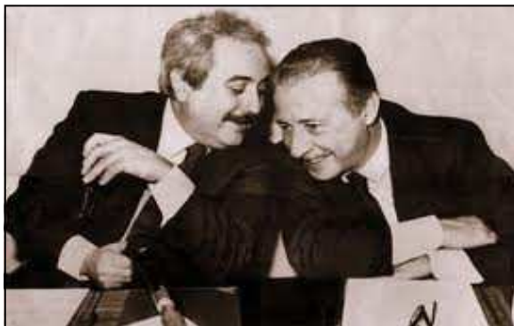
I giudici Giovanni Falcone e Paolo Borsellino, assassinati in due differenti stragi mafiose, a Capaci e in via D'Amelio a Palermo

Di conseguenza il termine viene spesso usato per indicare un modo di fare o meglio di organizzare attività illecite.