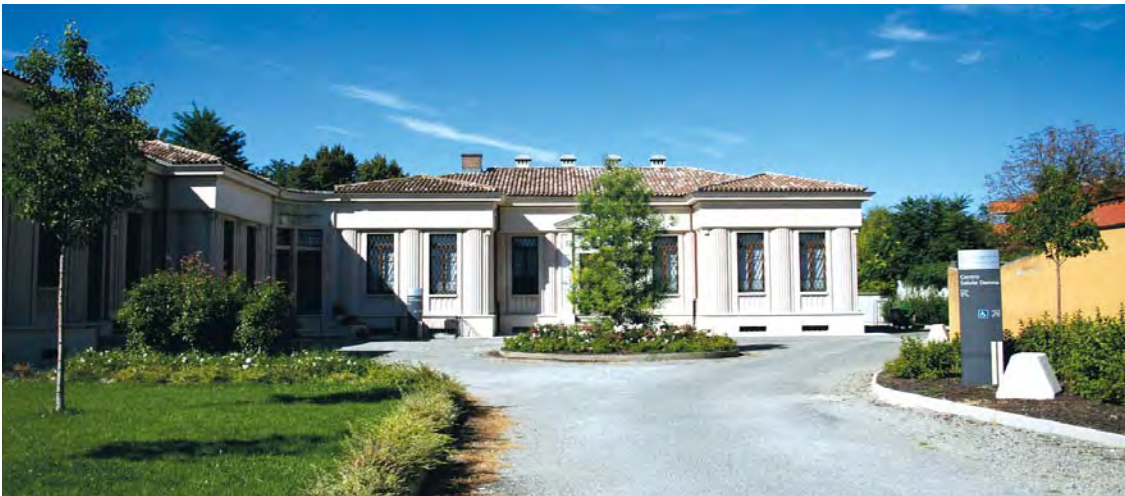
Centro Salute Donna Piacenza Piazzale Torino n. 7

Per apprendimenti vai alla sezione dedicata agli stranieri www.ausl.pc.it