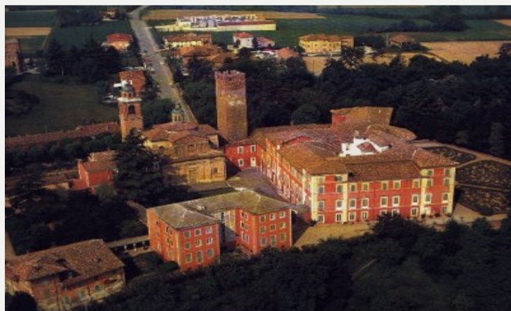
Castelnuovo Fogliani - Castello