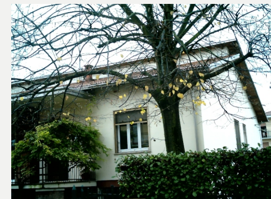
Alseno - l'Ambulatorio