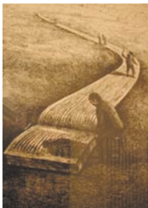
Percorso della Formazione

Le dimensioni dell'Azienda (n. 3.500 Operatori circa), la molteplicità delle sedi di lavoro (sette ospedali e più di cento sedi di lavoro territoriali), l'articolazione di attività e compiti lavorativi (sanitari, tecnici, amministrativi) rendono evidente la complessità organizzativa che il Datore di Lavoro deve affrontare per garantire il funzionamento di una struttura come quella in cui operiamo e, peraltro, l'inserimento nelle "regole" di funzionamento di quelle relative alla salute e sicurezza nei luoghi di lavoro ha ulteriormente aumentato la complessità di tale gestione. Il Servizio di Prevenzione e Protezione Aziendale ha individuato come punto strategico di un'Azienda come la Nostra la formazione e l'informazione Aziendale del personale nell'ambito della sicurezza nei luoghi di lavoro.