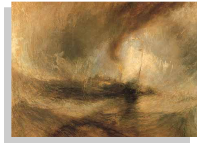
LA TEMPESTA DI NEVE William TURNER pittore inglese -XIX secolo