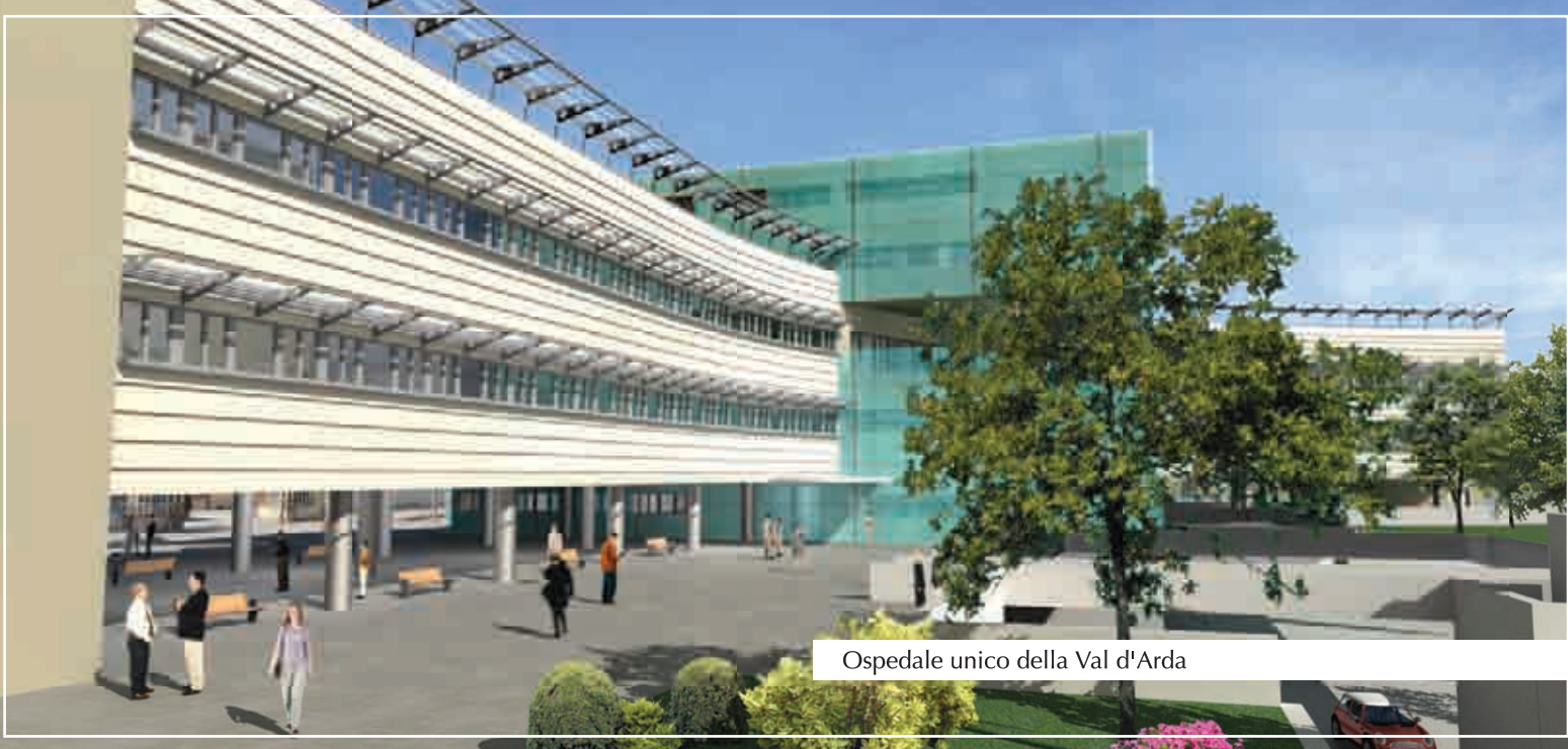
Ospedale unico della Val d'Arda